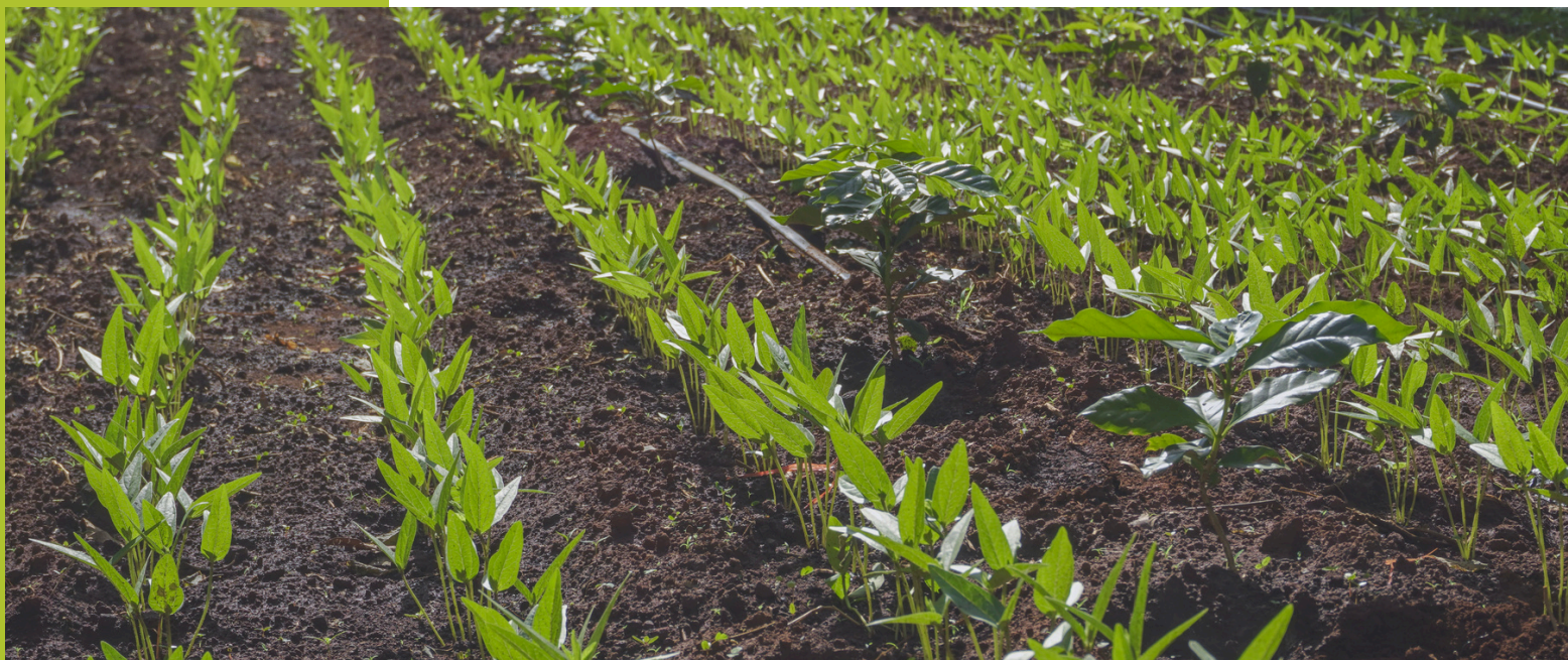
Trồng cây đậu xanh tạo thảm phủ xanh

Số lần bị xử phạt vi phạm do không tuân thủ luật pháp và các quy định về môi trường và Tổng số tiền do bị xử phạt vi phạm do không tuân thủ luật pháp và các quy định về môi trường: Không có.